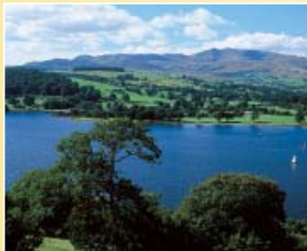
Distance: 23 miles Grade: difficult

This route, which takes you through the Berwyn mountain range, initially follows the same direction as route 11 but just before Llanuwchllyn heads south to start its climb up to Bwlch y Groes [at 546 metres, the highest road pass in Wales]. This is a demanding ride with lots of climbing and steep descents, but you will be rewarded with magnificent views of mountains and deep valleys carved by glaciers. Moorland birds thrive in this habitat and at the southern end of Llyn Efyrrwy [a man made reservoir] are Visitors' and RSPB information centres.