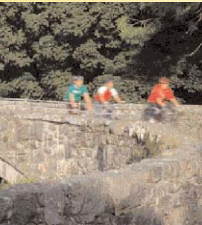
Bala - Llanuwchllyn Pellter: 10 milltir Graddfa: hawdd - cymhedrol

Mae'r daith hon yn dilyn ymyl Llyn Tegid, llyn naturiol mwyaf Cymru. Lleolir y llyn mewn hollt ddaearogol ac ynddo ceir y pysgod unigryw y gwyniad. Mae pysgota a hwylio yn boblogaidd yma, a cheir mynediad diogel at lan y llyn yn Llangower. Ar y daith hon gwelir Aran Fawddwy, Cadair Idris ac Arenig Fawr, rhai o fynyddoedd uchaf Eryri. Mae Rheilffordd Llyn Tegid yn cynnig gwasanaeth rhwng Y Bala a Llanuwchllyn a gellir cludo beiciau ar y tren os trefnir hynny ym mlaen llaw