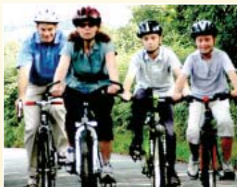
Llanuwchllyn - Dolhendre - Llanuwchllyn Pellter: 4 milltir Graddfa: hawdd

Taith feicio hamddenol yn dilyn rhan isaf a phrydferth afon Lliw, sydd hefyd yn boblogaidd gyda physgotwyr brithyll. Nepell o'r ffordd mae olion gwaith aur ac yng Ngharnodochan un o gestyll y Tywysog Llewelyn. Yn agos i bont Dolhendre edrychwch ar y plac wal diddorol ar y teras o elusendai. Cyn cyrraedd pentref Llanuwchllyn fe welwch gerflun o'r awdur a'r addysgwyr O.M.Edwards ac hefyd ei fab Syr Ifan ab Owen Edwards, sylfaenydd Urdd Gobaith Cymru.