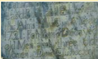
Llanuwchllyn - Dolhendre - Llanuwchllyn Distance: 4 miles Grade: easy

Taith feicio hamddenol yn dilyn rhan isaf a phrydferth afon Lliw, sydd hefyd yn boblogaidd gyda physgotwyr brithyll. Nepell o'r ffordd mae olion gwaith aur ac yng Ngharnodochan un o gestyll y Tywysog Llewelyn. Yn agos i bont Dolhendre edrychwch ar y plac wal diddorol ar y teras o elusendai. Cyn cyrraedd pentref Llanuwchllyn fe welwch gerflun o'r awdur a'r addysgwyr O.M.Edwards ac hefyd ei fab Syr Ifan ab Owen Edwards, sylfaenydd Urdd Gobaith Cymru.