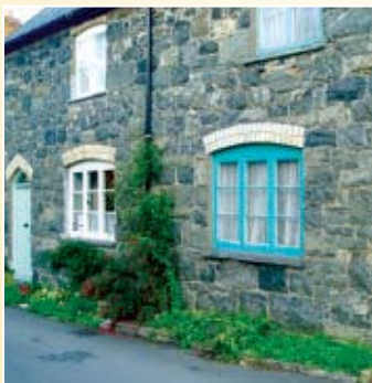
Llanuwchllyn - Trawsfynydd Pellter: 14 milltir Graddfa: anodd

Dyma un o hen ffyrdd y porthmyn, yn cysylltu Llanuwchllyn a Thrawsfynydd. Taith sy'n dringo trwy dir serth a gwyllt dyffryn afon Lliw a chyrraedd 530m [Bwlch Pen-y-Feidiog]. Yna'r ffordd yn troelli a disgyn am Drawsfynydd ac yn croesi olion ffordd Rufeinig Sarn Helen gyda Chadair Idris a Rhinogydd yn drawiadol y pellter. Yn Nhrawsfynydd mae Canolfan Tref-tadaeth [Llys Ednowain] a nepell yng Nghoed y Brenin ceir un o ganolfannau beicio mynydd gorau ym Mhrydain.